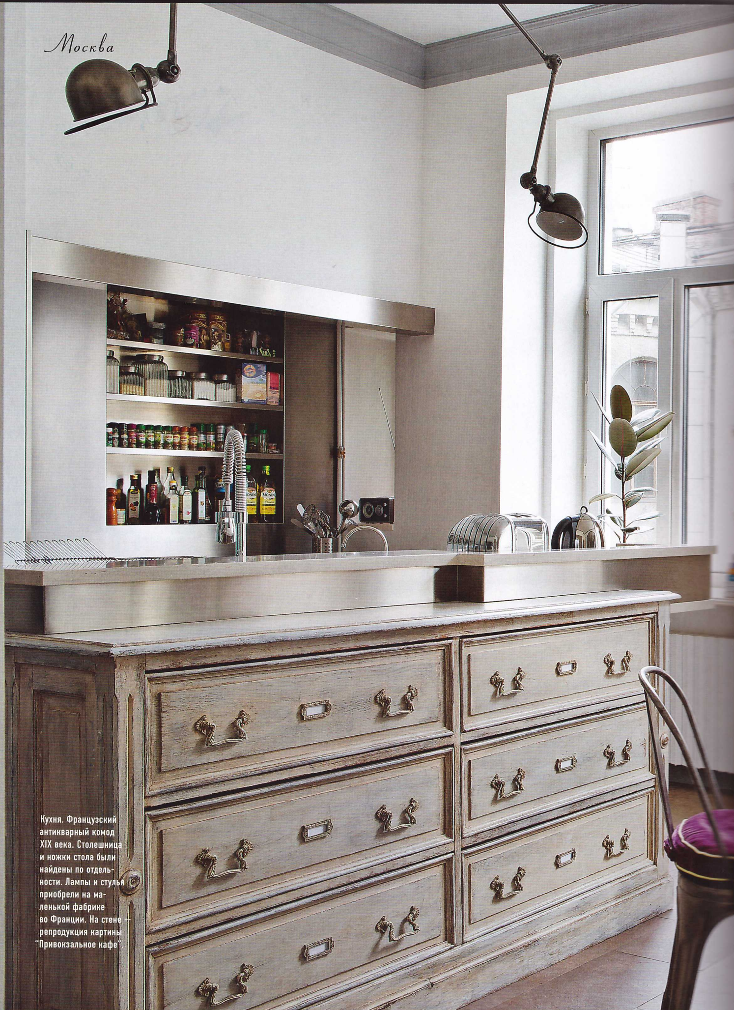
Кухня. Французский антикварный комод XIX века. Столешница и ножки стола были найдены по отдельности. Лампы и стулья приобрели на маленькой фабрике во Франции. На стене — репродукция картины "Привокзальное кафе"