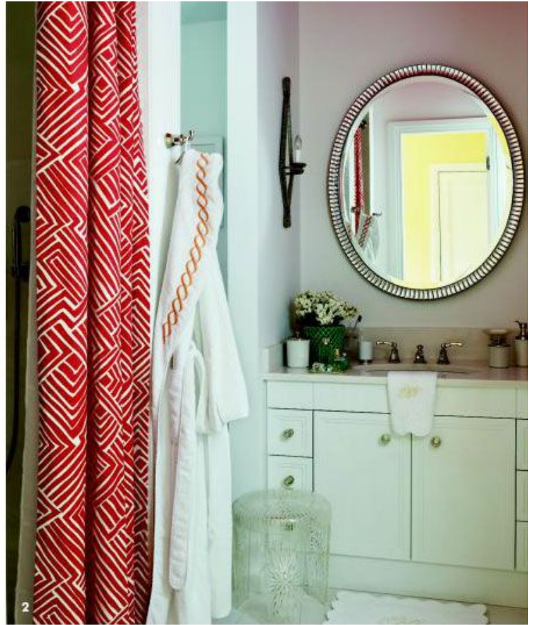
НА ЭТОЙ СТРАНИЦЕ 1 Спальня дочери. Кровать сделана по эскизам декоратора. Тумбочки, С. Vell. Зеркало, Dorothy D'Arcy. Винтажная этажерка куплена в Палм-Бич. Люстра, Vaughan. 2 Ванная комната. Все, от встроенной мебели до халата, сделано на заказ. 3 Гостевой санузел. Стены оклеены обоями ручной печати. НА СТРАНИЦЕ СПРАВА Комната сына. Постельное белье, Pratesi. Прикроватные тумбы сделаны на заказ. Стены и абажуры настольных ламп (Америка, 1970-е годы) оклеены обоями, Fonfill.