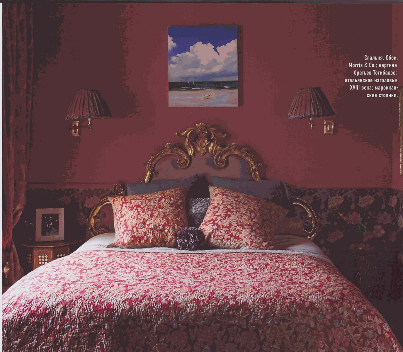
Спальня. Обои, Morris & Co.; картина братьев Тотибадзе; итальянское изголовье XVIII века; марокканские столики.