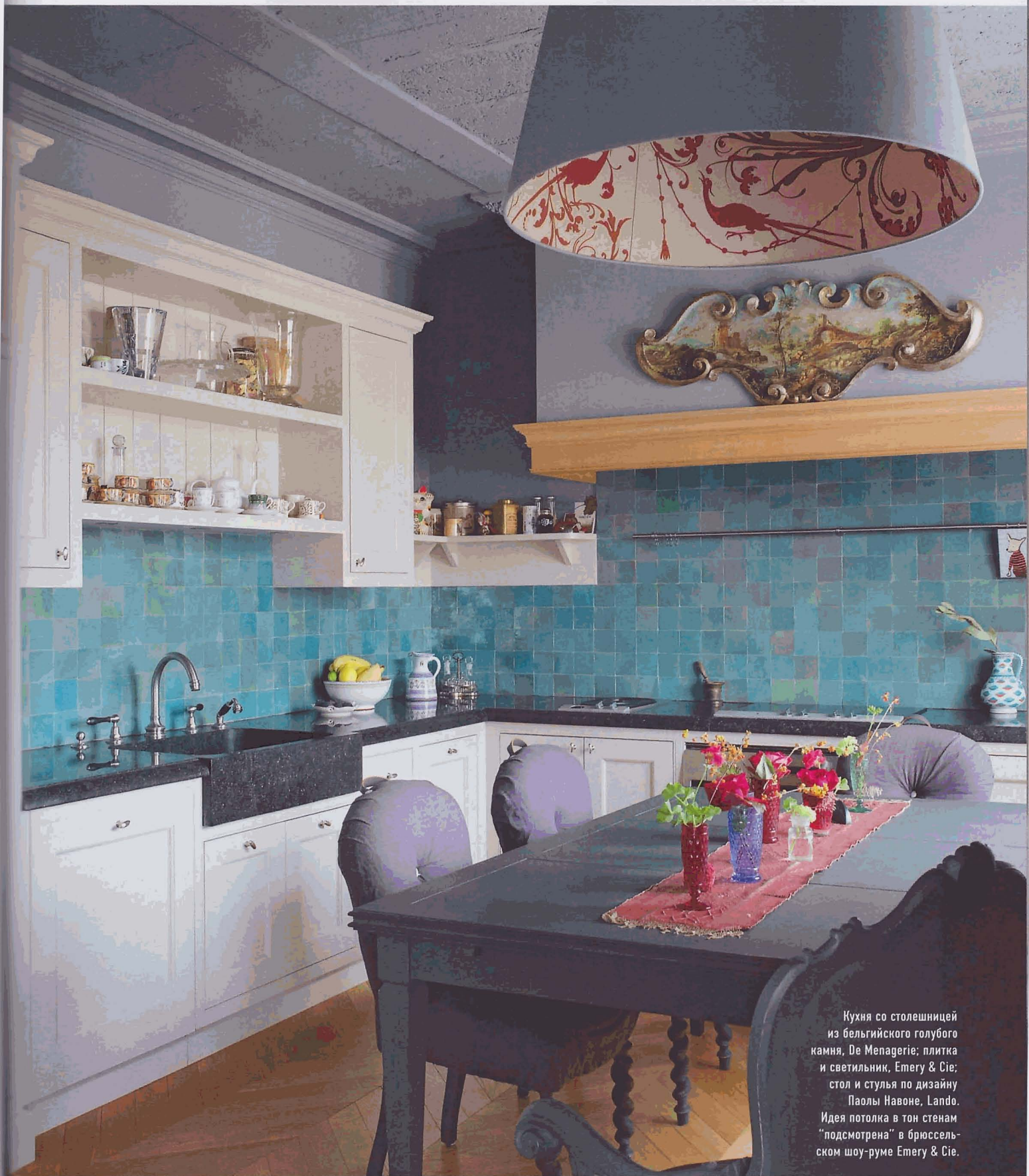
Кухня со столешницей из бельгийского голубого камня, De Menagerie; плитка и светильник, Emery & Cie; стол и стулья по дизайну Паолы Навоне, Lando. Идея потолка в тон стенам "подсмотрена" в брюссельском шоу-руме Emery & Cie.