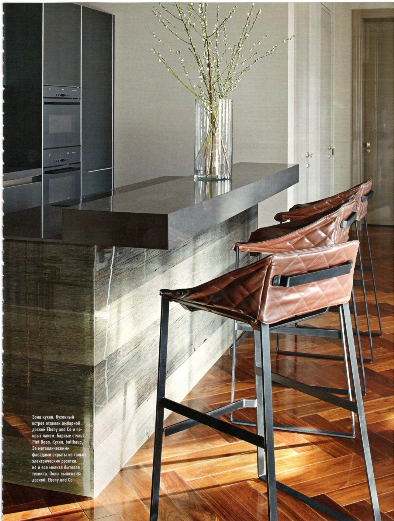
Зона кухни. Кухонный остров отделан амбарной доской Ebony and Co и покрыт лаком. Барные стулья, Piet Voop. Кухня, bulthaup. За металлическими фасадами скрыты не только электрические розетки, но и вся мелкая бытовая техника. Полы выложены доской, Ebony and Co.