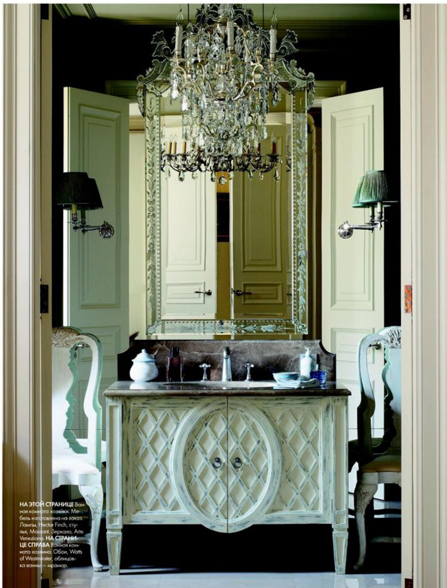
НА ЭТОЙ СТРАНИЦЕ Ванная комната хозяйки. Мебель изготовлена на заказ. Лампы, Hector Finch, стулья, Massant. Зеркало, Arte Venezia. НА СТРАНИЦЕ СПРАВА Ванная комната хозяйки. Обои, Watts of Westminster, облицовка ванны — мрамор.