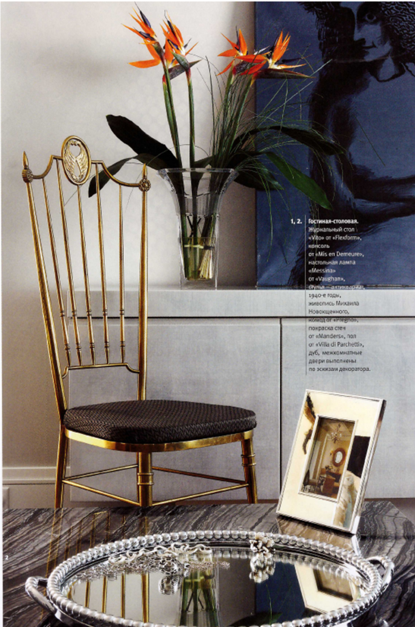
1, 2. Гостиная-столовая, Журнальный стол «Vito» от «Flexform», консоль от «Mis en Demeure», настольная лампа «Messina» от «Vaughan», Стулья — антиквариат, 1940-е годы, живопись Михаила Новокщеного, комод от «Inregno», покраска стен от «Manders», пол от «Villa di Parchetti», дуб, межкомнатные двери выполнены по эскизам декоратора.