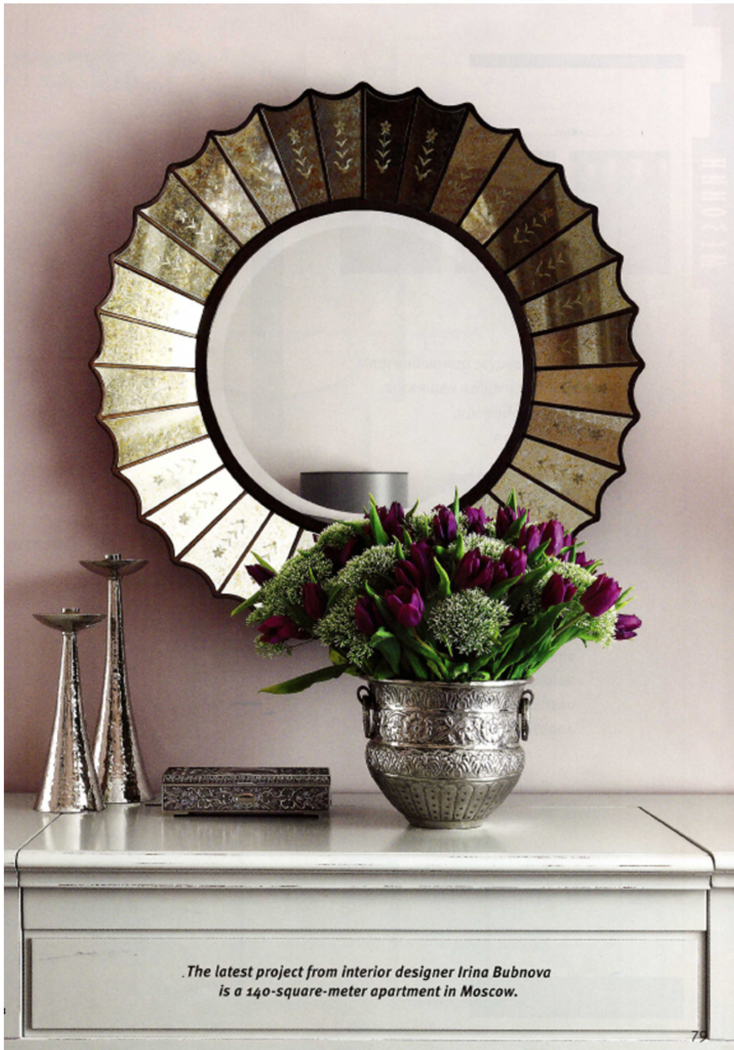
The latest project from interior designer Irina Bubnova is a 140-square-meter apartment in Moscow.